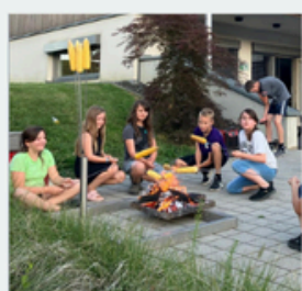
08.08.2025 Woazbrotn - Jugend