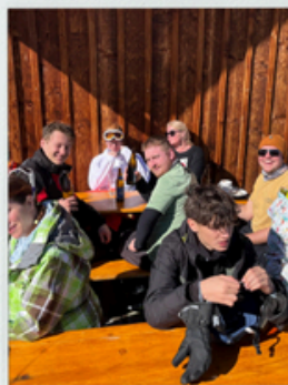
22.02.2025 Skitag Reichenfels