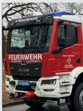
Empfang unseres neuen HLF3