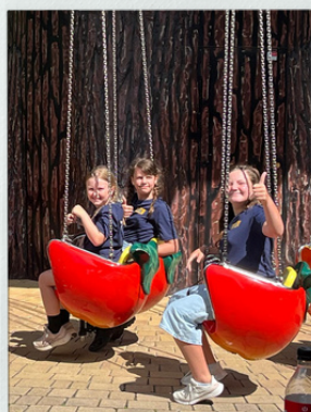
Jugendarbeit wird groß geschrieben