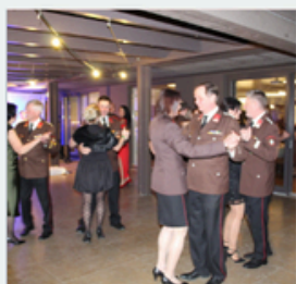
08.02.2025 FF Ball