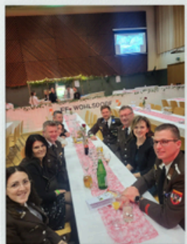
01.02.2025 Ball FF Wohlsdorf