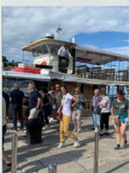
September 2025 FF Ausflug