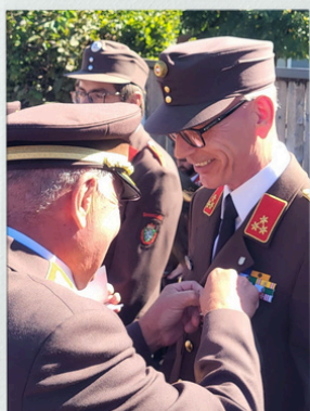
Abzeichen und Auszeichnungen